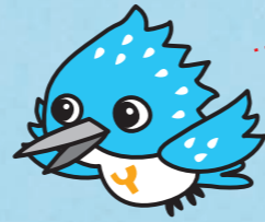
ヤマセ不動産イメージキャラクター「ヤマセミくん」

私たちは、さまざまな情報を収集して人と土地の出会いを支援しております。お客様との密なるコミュニケーションを基本に、信頼関係を築き、理想的なトータルコーディネートを行うことこそ、私たちの使命だと考えております。「お客様」からの「ありがとう」の言葉をチカラに、これからも時代のニーズに応える確かなサービスを提供し続けます。