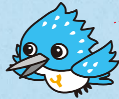
ヤマセ不動産イメージキャラクター「ヤマセミくん」

私たちは、さまざまな情報を収集して人と土地の出会いを支援しております。お客様との密なるコミュニケーションを基本に、信頼関係を築き、理想的なトータルコーディネートを行うことこそ、私たちの使命だと考えております。「お客様」からの「ありがとう」の言葉をチカラに、これからも時代のニーズに応える確かなサービスを提供し続けます。